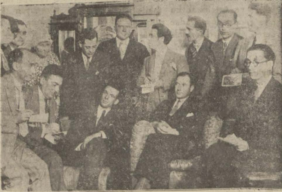
Amerikalı tayyareciler gazetecilere kazandıkları büyük muvaffakiyeti anlatıyorlar

Amerikada iken Türkiye ve onun büyük reisi Gazi Hz. hakkında çok şeyler işidiyor-